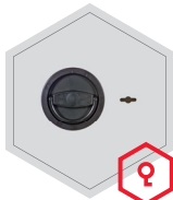
Doppelbartschloss (Ausser Art. 33000)