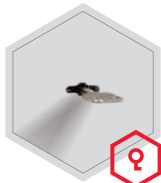
Doppelbartschloss (Art. 33000)

Optionale Verschlussvarianten gegen Mehrpreis