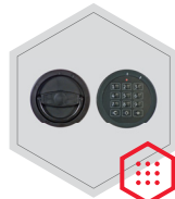
Elektronisches Kombinationsschloss (Ausser Art. 33000)