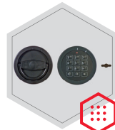
Elektronischschloss kombiniert mit mechanischer Revision (Ausser Art. 33000)