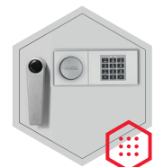
Elektronisches Kombinationsschloss B 30 (Ausser Art. 419100.00)