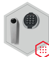
Elektronisches Kombinationsschloss Primor 3000 level 15