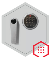
Elektronisches Kombinationsschloss Solar Basic