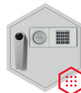
Elektronisches Kombinationsschloss B 30 (Ausser Art. 419100.00)