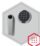
Elektronisches Kombinationsschloss Primor 3000 level 5