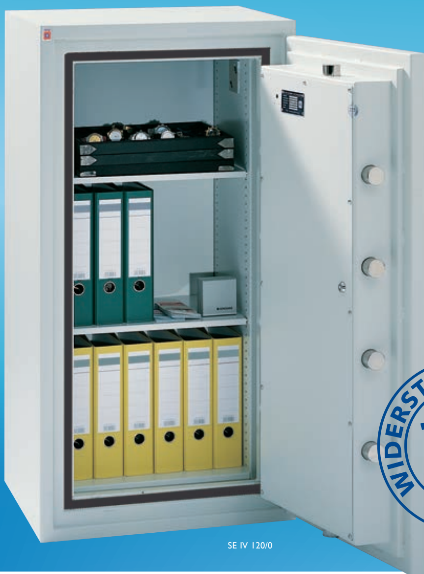
SE IV 120/0