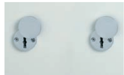
Grundausrüstung: 2 x DSS mit Schlüsselrosette (Standard)