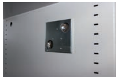
Vorbereitung für eine Alarmkomplettausstattung